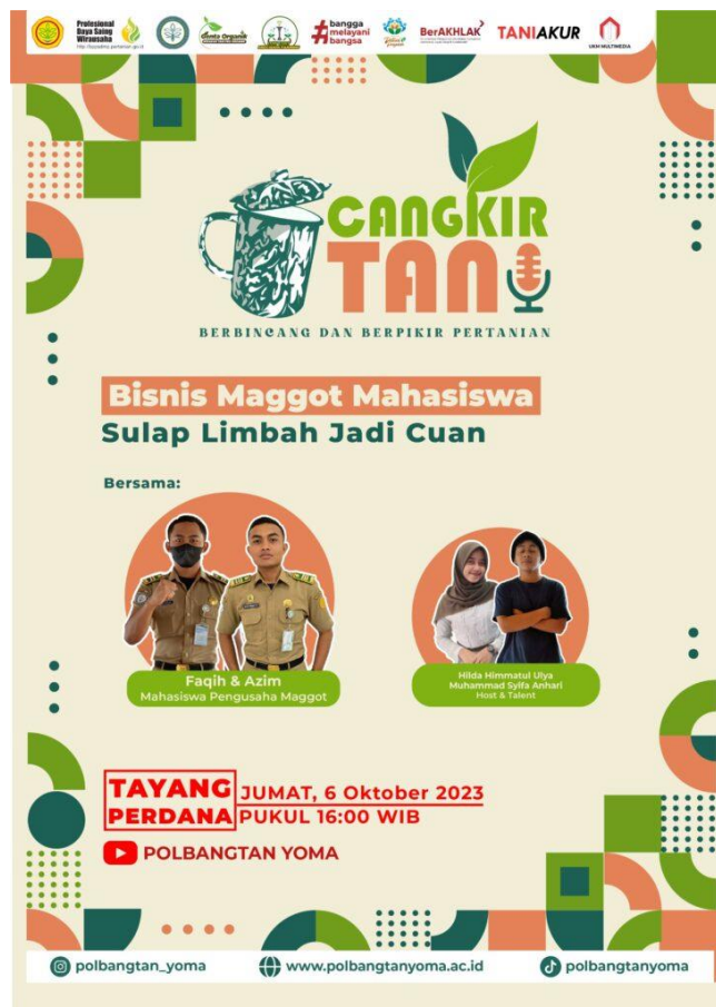
Gambar 2. Modul Utama kegiatan Cangkir Tani

Multimedia ini merupakan aplikasi interaktif sistem stand alone – event based (DVD), yaitu membimbing user dalam melakukan langkah-langkah tertentu dalam membuat homepage. Materi pembuatan homepage ini dibagi menjadi 8 session/modul pelatihan, mulai dari materi pengeditan teks hingga materi pembuatan frame (dasar pembuatan homepage). Modul yang dikembangkan terdiri dari 2 bagian yaitu modul utama yang bersifat interaktif serta modul video untuk memberikan contoh pengembangan. Khusus untuk modul video, teknik yang digunakan adalah melakukan perekaman kegiatan yang dilakukan di layar komputer. Hasil dari proses perekaman berupa format .avi . yang disempurnakan dengan video editing.