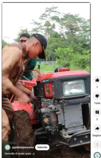
Gambar 3. Video peraga praktikum Alsintan