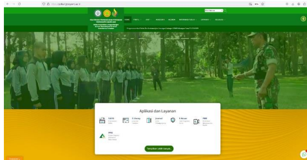
Gambar 4. Portal website polbangtan yoma

Berikut ini tabel yang menjelaskan jenis materi ( e-content ) yang diterapkan pada web portal: