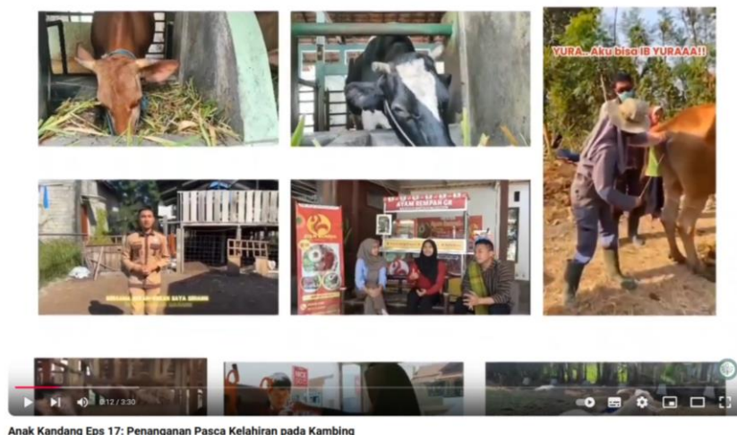
Gambar 1. Tampilan Video Tutorial

video tutorial adalah gambaran rangkaian hidup yang ditayangkan oleh seorang pengajar yang berisi pesan-pesan pembelajaran untuk membantu pemahaman terhadap suatu materi pembelajaran sebagai bimbingan atau bahan pengajaran kepada sekelompok kecil peserta didik.